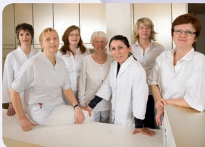
Praxisteam von links nach rechts:

Durch mannigfaltige Eingriffe mit modernster Technik am Herzen und den Gefäßen (Becken-, Bein-, Nieren- und gehirnzuführende Gefäße) lässt sich die Lebensqualität nachhaltig verbessern.